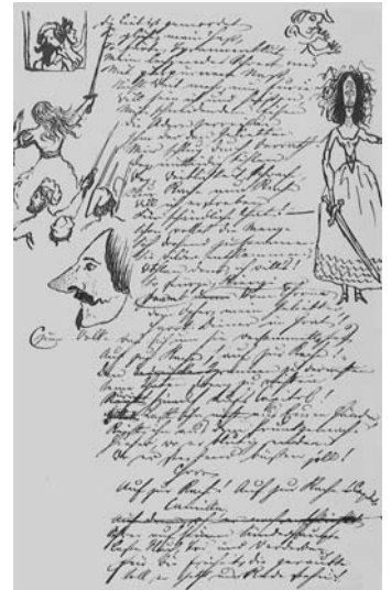
Faksimile einer Seite aus dem Libretto-Skript

land, erfunden hat sie, Jim Knopf, Lukas und Co. Michael Ende. 10) Die „deutsche Ilias“: das Nibelungenlied. 11) Karl Zuckmayer schrieb den „Schinderhannes“, den „Hauptmann von Köpenick“ und „Des Teufels General“. Seine Tochter nannte der Karl-May-Fan „Winnetou“. 12) Gemeint ist die Ausdruckstänzerin Isadora Duncan, deren Schal sich 1927 in Nizza beim Anfahren ihres Cabrios in dessen Speichen verfang. Der Ruck brach ihr das Genick.