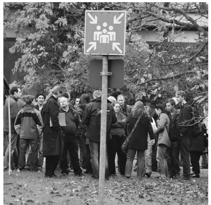
Über den ganzen Campus verteilt sind grün-weiß markierte Schilder aufgestellt: Sammelstellen für Notfälle.