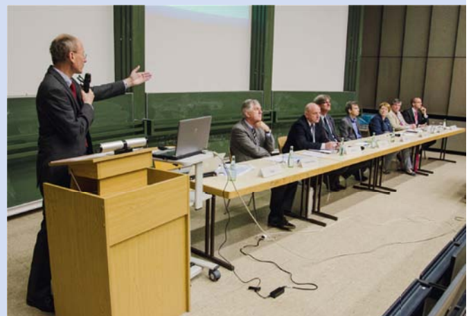
▶ Am 11. Juli fand eine sehr gut besuchte Informationsveranstaltung zum Thema „Asbesthaltige Spachtelmassen an Trockenbauwänden“ statt. Es sprachen und diskutierten: Rektor, Kanzler, Vertreter des BLB, Mediziner, der Sicherheitsbeauftragte der HHU und der Dezernent für Gebäudemanagement.

Die verantwortlichen Führungskräfte haben dafür Sorge zu tragen, dass alle Personen in ihrem Verantwortungsbereich über diese Dienstanweisung in Kenntnis gesetzt sind und entsprechend unterwiesen werden. Diese Unterweisung ist durch Unterschrift des Unterweisenden und der Unterwiesenen schriftlich zu dokumentieren. Die verantwortlichen Führungskräfte haben ferner dafür Sorge zu tragen, dass diese Dienstanweisung in ihrem Verantwortungsbereich eingehalten wird.“