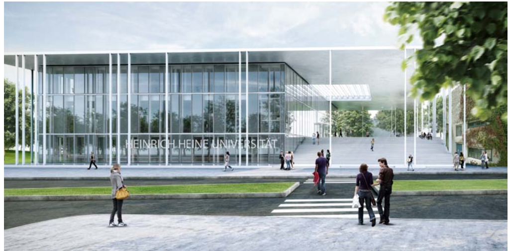
► So wird es aussehen: das neue Studierenden Service Center. In dem Gebäude, das dann an Hörsaal 3 A angrenzt und gegenüber der Mensa an der Universitätsstraße gelegen ist, werden alle Dienstleistungen für Studierende untergebracht sein. (Foto: kadawittfeldarchitektur, Aachen)

Der Neubau – der das „Tor zum Campus“ sein wird – ist einzigartig. Er orientiert sich konsequent an den Bedürfnissen seiner Nutzer und bietet genügend Platz, um das neuartige organisatorische Konzept auch mit externen Partnern umzusetzen: Betreuung und Dienstleistung beginnen vor der Bewerbung an der HHU und enden erst nach dem Examen. „Wir sind die erste Universität in Deutschland, die die Funktionalität