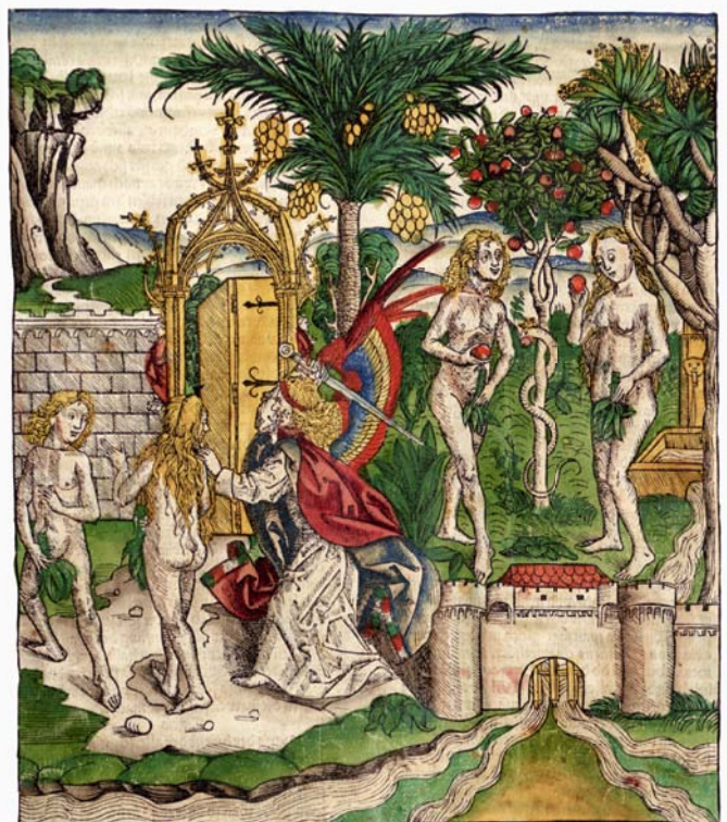
► Adam und Eva im Paradies (Abbildung aus der „Schedel’schen Weltchronik“ von 1493).