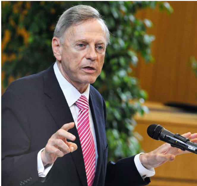
► HHU-Hochschulratsmitglied Avi Primor.

Avi Primor, früherer israelischer Botschafter in Deutschland und Mitglied des HHU Hochschulrats, erhielt am 5. Juni 2013 in Berlin die Moses Mendelssohn Medaille. Damit würdigt das Potsdamer Moses Mendelssohn Zentrum für jüdische Studien (MMZ) Primors Engagement im deutsch-israelischen Dialog, seine Bemühungen um die israelisch-palästinensische Verständigung sowie um vertiefte Kontakte zur EU.