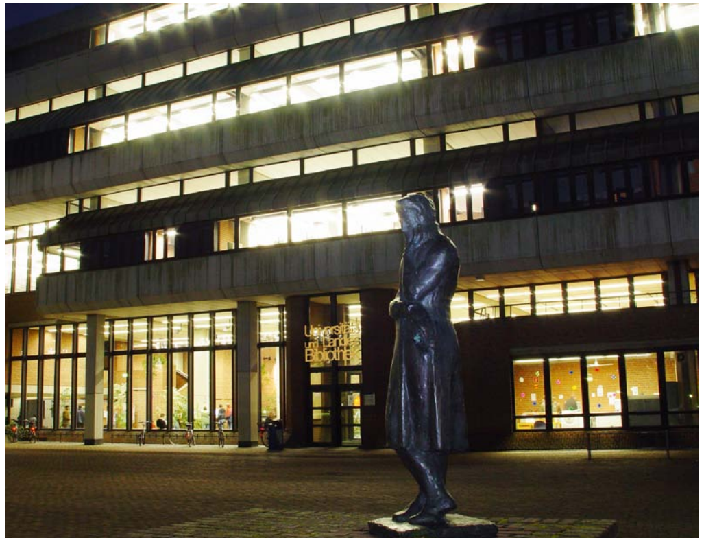
► Die Düsseldorfer ULB gehört zur Spitzengruppe der deutschen Universitätsbibliotheken. In NRW ist sie Nummer 1.

Mit langen Öffnungszeiten, einem hohen Ausgabenanteil für elektronische Medien und einer großen Anzahl von Arbeitsplätzen punktet die ULB in der Zieldimension „Angebot“ bereits seit mehreren Jahren. 2012 wurde der Ausgabenanteil für elektronische Medien, der zuletzt deutlich über 50 Prozent lag, nochmals erhöht und liegt nun bei 60,9 Prozent. Zudem konnte mit der Einrichtung eines Selbstlernzentrums in den Gebäuden der Mathematisch-Naturwissenschaftlichen Fakultät die Zahl der Arbeitsplätze auf 2.300 ausgebaut werden. Attraktive Bestände und Arbeitsplätze schlagen sich in den